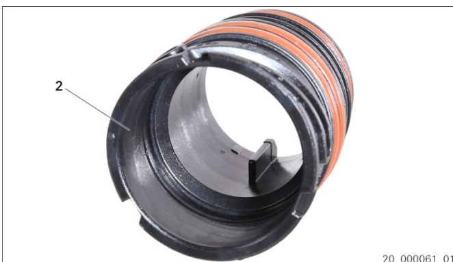
Fig. 3: Føringshylse