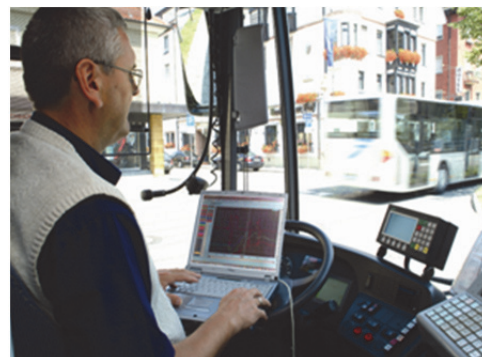
Abb. 2: ZF-TESTMAN im Einsatz