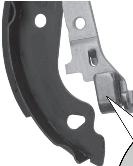
TRW - ontwerp