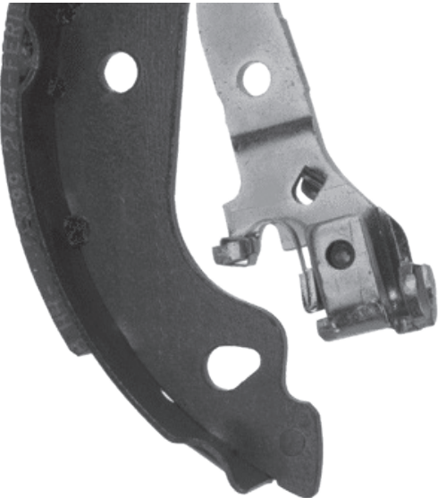
OE - ontwerp