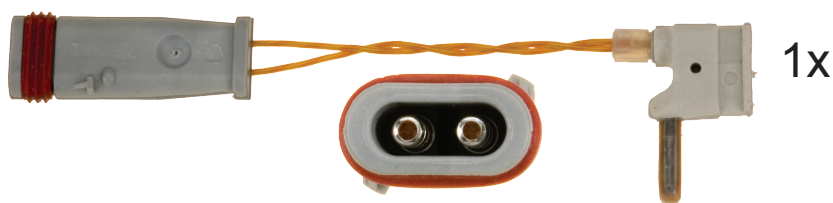
индикатор 50%-го износа