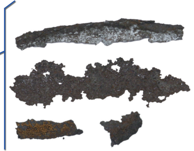
Paslanan parçalar (Büyütülmüş görünüm)