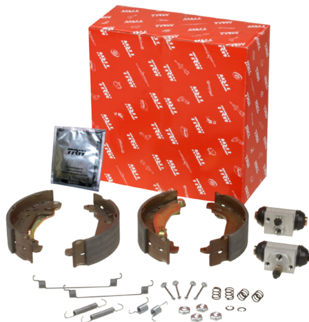
Brzdových kitech (BK)