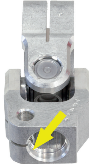
Girintili yeni mafsal çatalı