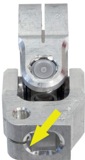
Stary przegub (wał kierownicy) bez wgłębienia