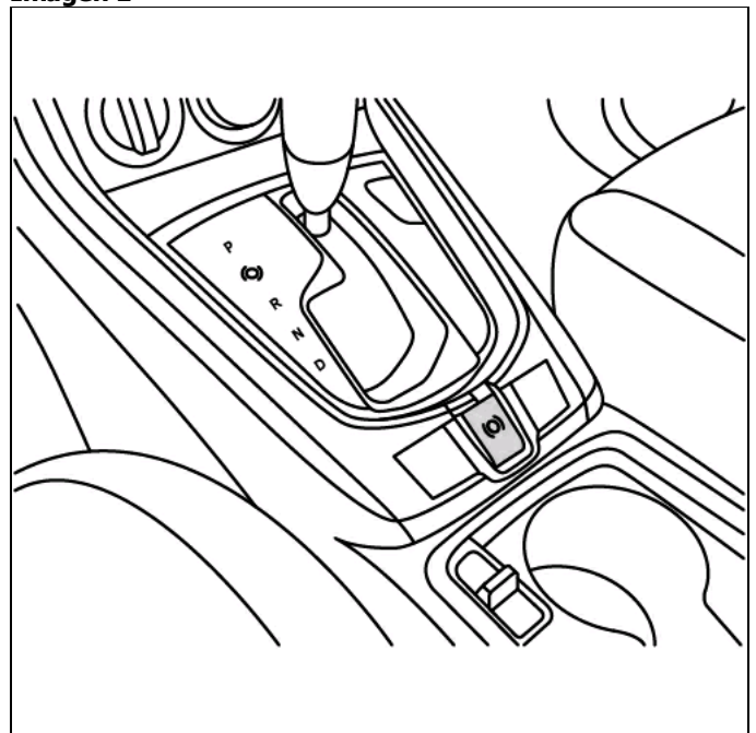
1 Interruptor del freno manual