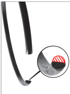
Illustr. 3: borgring versleten.