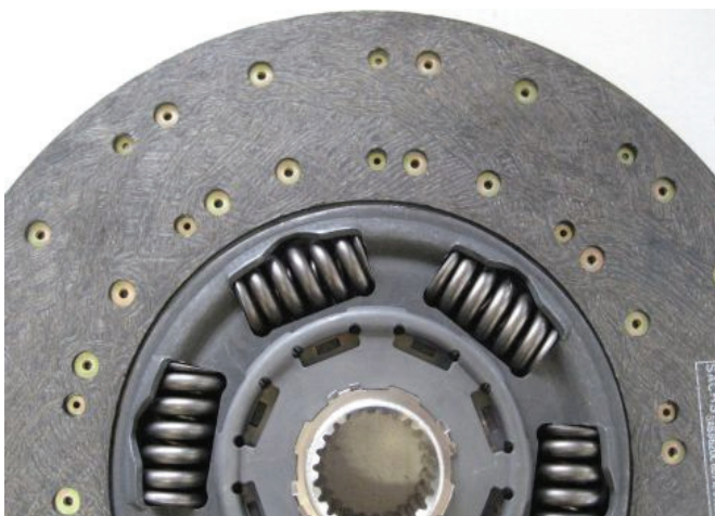
Obr.č. 3: Obložení lamely na straně k převodovce

Obložení na straně k převodovce (Obr.č.3) se nejprve lepí na jiný, nosný plech, na který se pak nanýtují torzní pružiny.