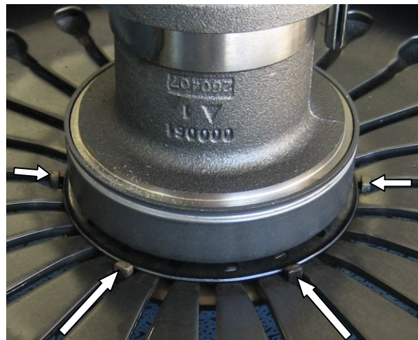
Slika 3: stranski pogled na vodilne nastavke (vidni so štiri od šestih)