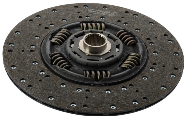
Fig. 1: Butuc acoperit cu emulsie