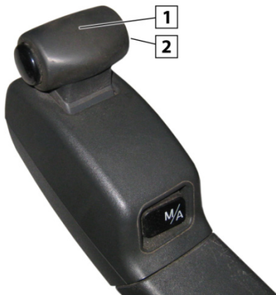
Sl. 3: EPS2 poluga za biranje