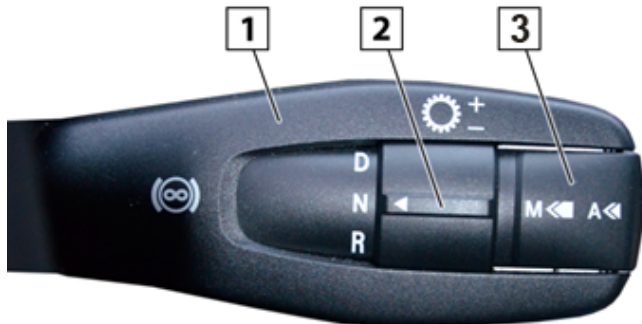
Sl. 5: EPS3 poluga za biranje