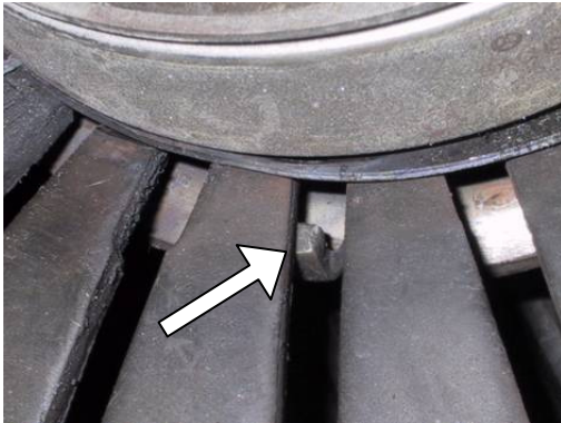
Sl. 1: Pogrešno sjedište drške za vođenje prstena odvajča – drška je gumuta ispod membranske opruge

Pri udaru prilikom transporta ili grješke u rukovanju odvajča može biti izbačen iz centralne pozicije koja je potrebna za funkcioniranje (vidi sliku 1).