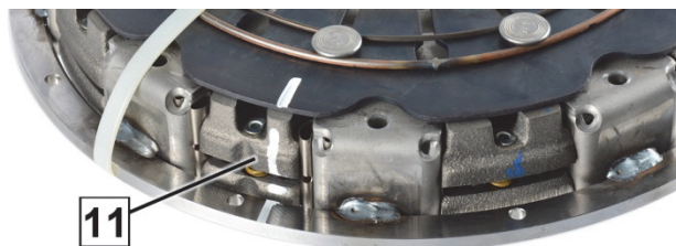
6. ábra: Jelölés a kuplung házán