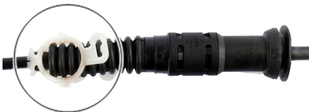
Sl. 5: Otpušten osigurač

→ Potezna sajla se nakon pritiska na papučicu kvačila automatski podešava.