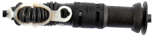
Sl. 2: Osigurač sa plastičnim zatvaračem

Potezne sajle sa automatskim regulacionim mehanizmom osigurane su bajonetnim zatvaračem (sl. 1) ili belom plastičnom trakom (sl. 2).