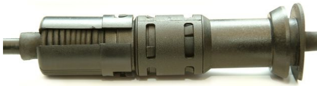
Sl. 1: Osigurač sa bajonetnim zatvaračem