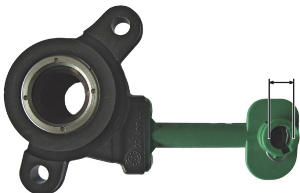
SI. 1: CSC 3182 600 121 → 3182 654 165 prečnik hidrauličkog priključka 11,7 mm