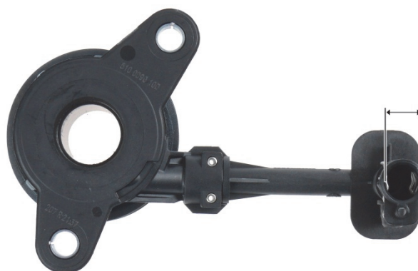
SI. 4: CSC 3182 600 140 → 3182 654 204 prečnik hidrauličkog priključka 12,2 mm

Molimo Vas da obratite pažnju na to da hidraulički priključci odva- jača nisu srazmerno prikazani.