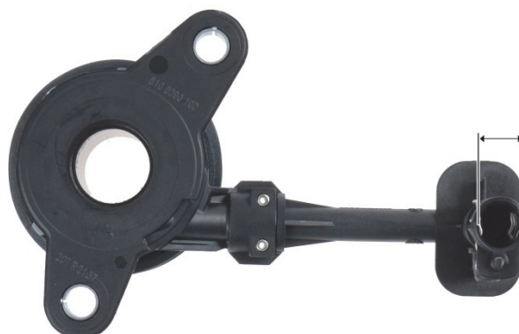
Рис. 4: CSC 3182 600 140 → 3182 654 204 Диаметр штуцера гидросистемы 12,2 мм

Обратите внимание, что штуцеры гидросистемы выключателей сцепления показаны не в масштабе.