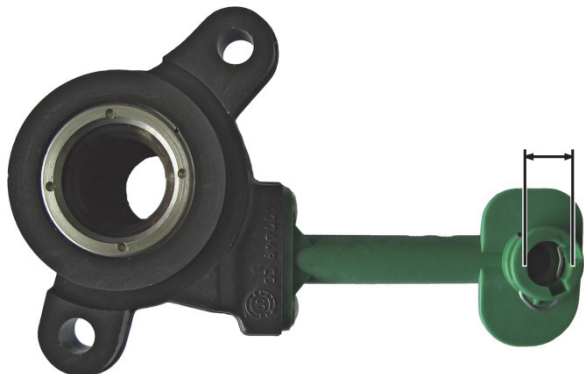
Рис. 1: CSC 3182 600 121 → 3182 654 165 Диаметр штуцера гидросистемы 11,7 мм