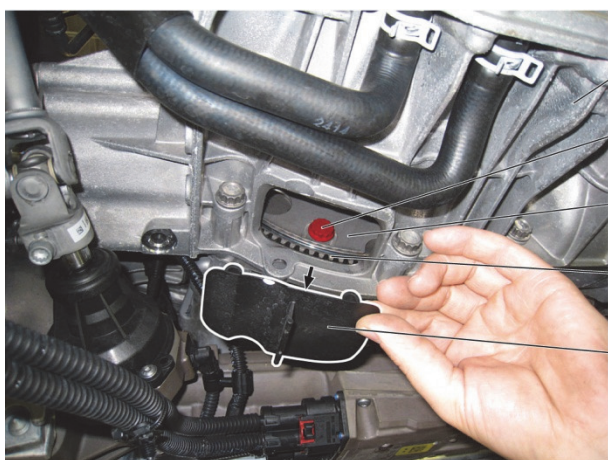
Fig. 1 : Démontez le couvercle (5)