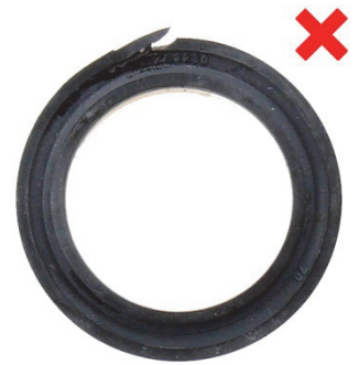
Kuva 7: Huulitiiviste (1) leikkautunut