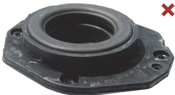
Sl. 1: Neispravno montiran ležaj za oslanjanje amortizera

Citroën Berlingo / Xsara / ZX Peugeot 306 / Partner