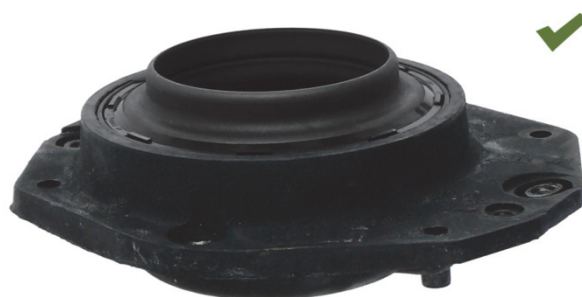
Sl. 2: Ispravno montiran ležaj za oslanjanje amortizera