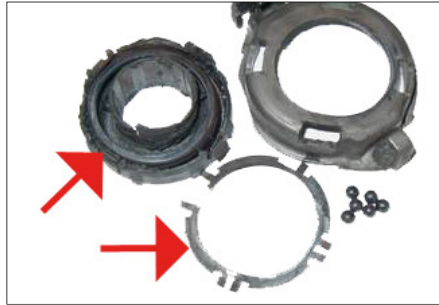
Sl. 4: Mehanička oštećenja i pregrevanje na isključnoj polugi