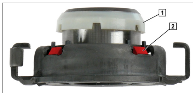
Fig. 2: Dispozitiv de debreiere