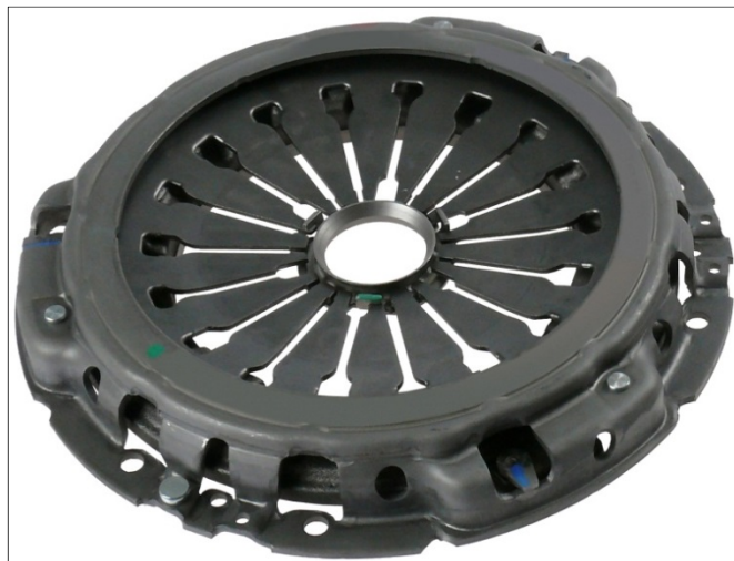
Fig. 1: Placă presiune ambreiaj - versiune cu cablu