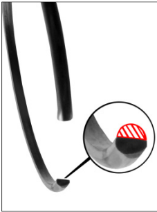
Fig. 3: Inel de siguranță uzat. → Dispozitivul de debreiere se desprinde din arcul tip diafragmă → Aderență bruscă