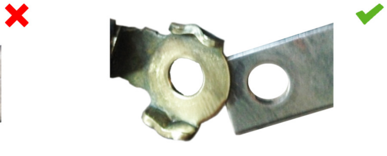
2. ábra: Testcsatlakozás tisztítás után: jó érintkezés