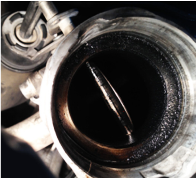
Sl. 4: Loputa ventila za recirkulacijo izpušnih plinov (ventil AGR) zoglanela