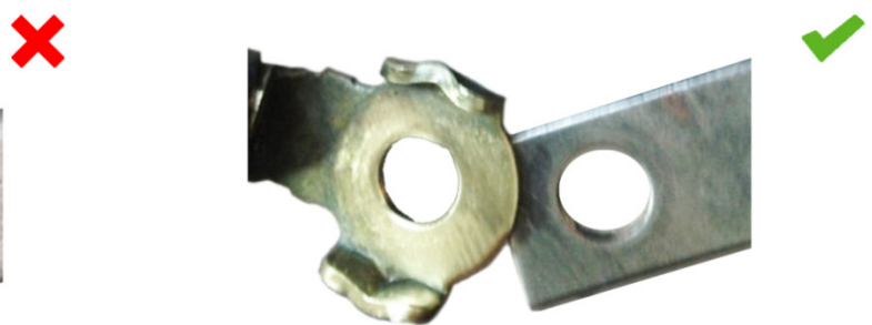
sl. 2: Spoj na masu nakon čišćenja: dobar kontakt