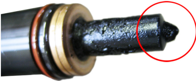
sl. 3: Element raspršivača pumpe zapekao