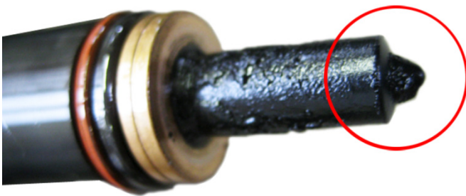
Fig. 3: Pumpe-dyse element forkokset