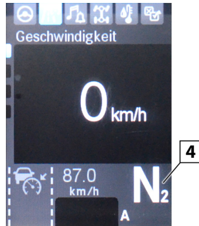
Obr. 6: EPS3 displej