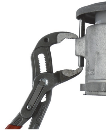
Fig.3: Ajuste de las espigas entalladas