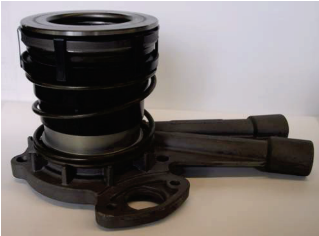
Fig. 1: 3182 998 501 sin sensor