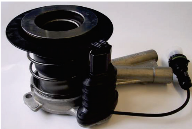
Fig. 3: 3182 600 101 con sensor