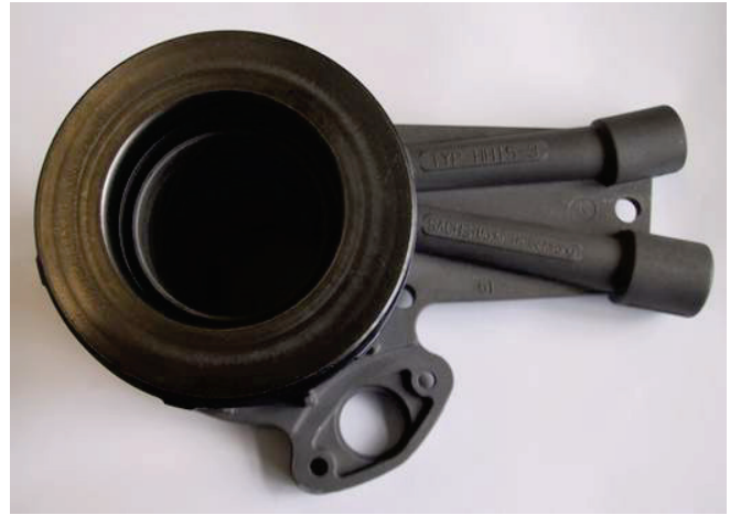
Fig. 2: 3182 998 501 sin sensor