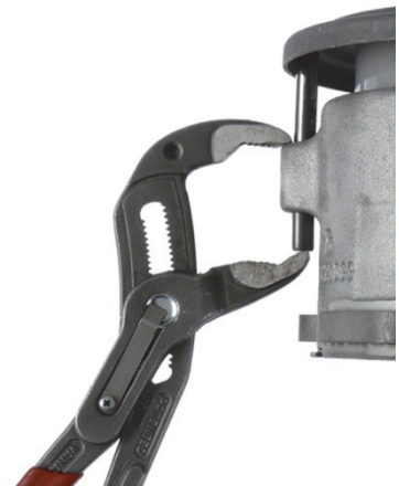
Slika 3: Nastavitev zarezanih zatičev