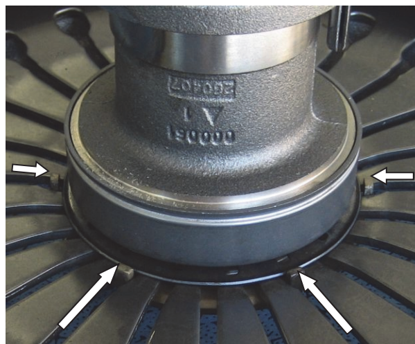
Fig. 3: žlebovi sa strane (vidi se samo 4 od ukupno 6!)