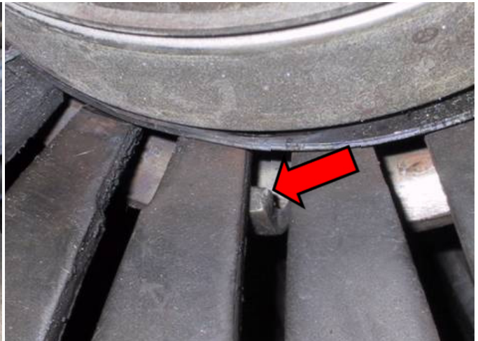
Sl. 2: Pogrešan položaj vodećeg rukavca prstena odvajača – rukavac je skliznuo ispod membranske opruge

Vodeći rukavac (sl. 1) mora da leži između otvora vrhova membranske opruge. Ako usled pogrešnog rukovanja ili neprimerenog transporta neki od rukavaca sklizne pod vrhove membranske opruge, odvajač ne radi centrirano odnosno zanosi i time neminovno dovodi do kvara.