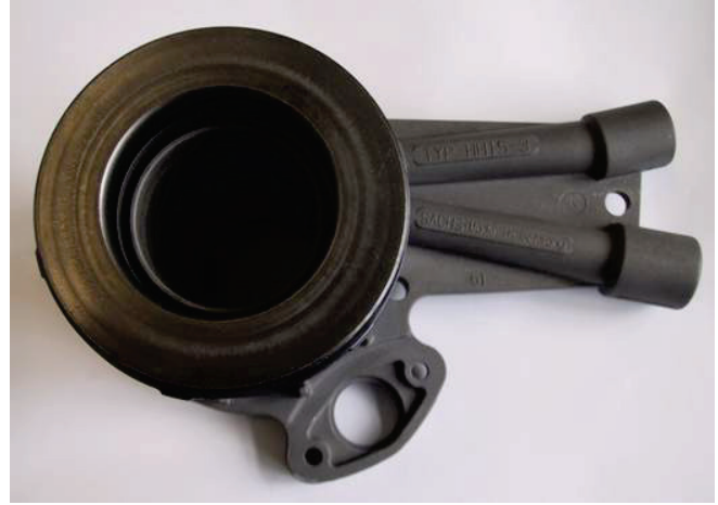
Fig. 2: 3182 998 501 без датчика положения