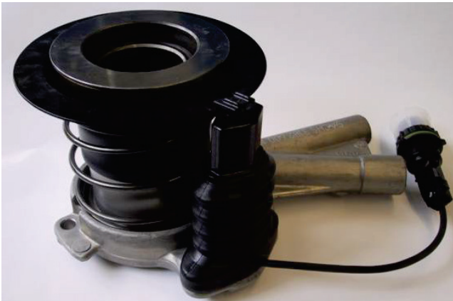
Fig. 3: 3182 600 101 с датчиком положения