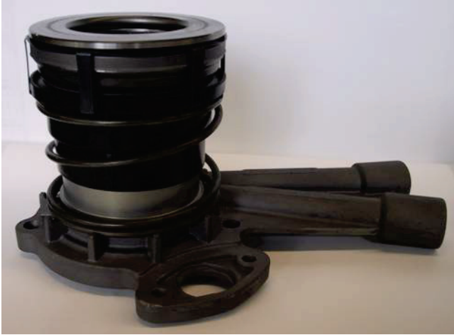
Fig. 1: 3182 998 501 без датчика положения