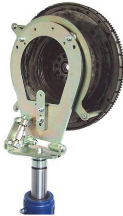
Fig. 2: Adaptor pentru volant cu masă dublă Blitz Rotary, cod articol 3745430