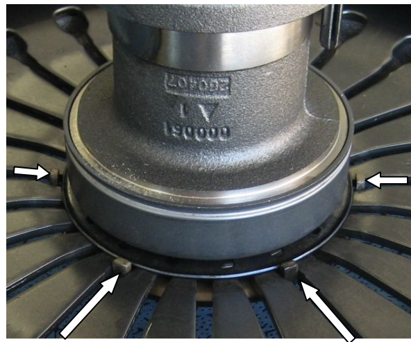
Afb. 3: Geleidehaken zij aanzicht (alleen vier van de in totaal zes stuks zijn zichtbaar)