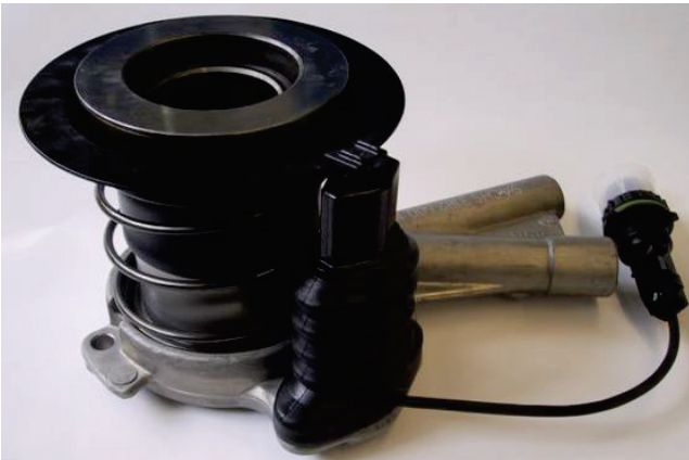
Fig. 3: 3182 600 101 asentoanturilla