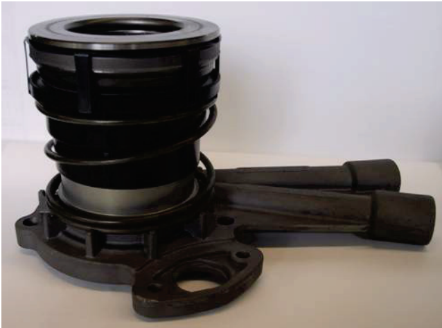
Fig. 1: 3182 998 501 ilman asentoanturia