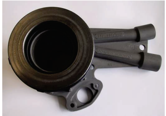
Fig. 2: 3182 998 501 ilman asentoanturia