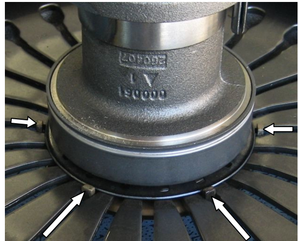
Kuva. 3: Ohjaintapit sivultapäin (vain neljä tppia kuudesta näkyvissä!)