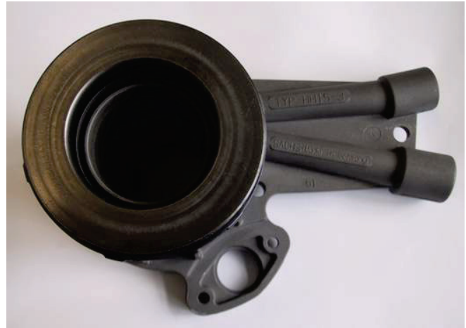
Abb. 2: 3182 998 501 ohne Weg-Sensor