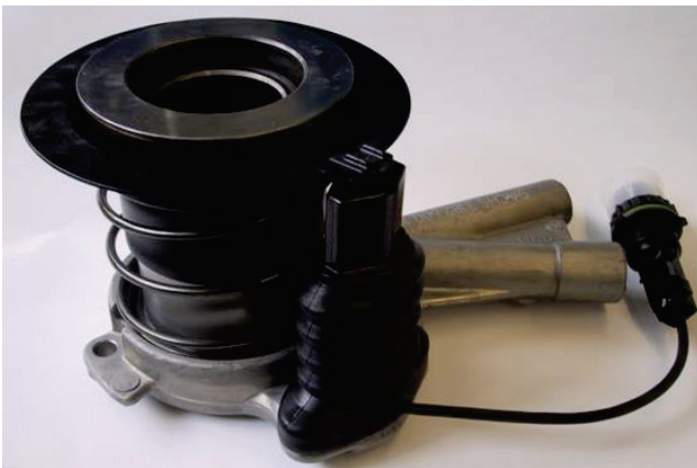
Abb. 3: 3182 600 101 mit Weg-Sensor