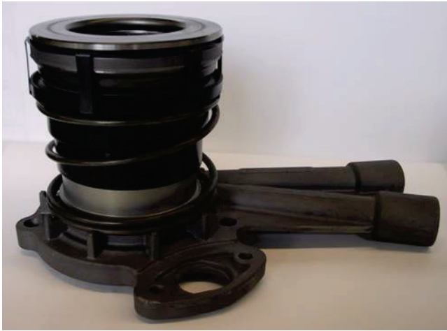
Abb. 1: 3182 998 501 ohne Weg-Sensor