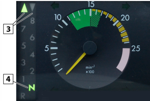
Fig. 2: EPS1 display