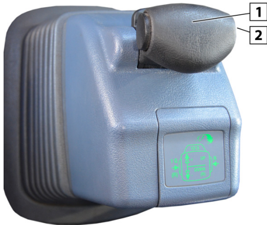
Fig. 1: EPS1 gearstang