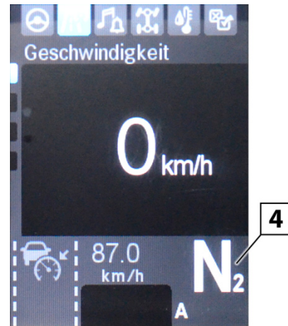
Fig. 6: EPS3 display