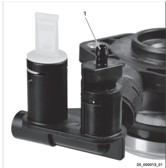
2 ábra: példa az „A” változathoz