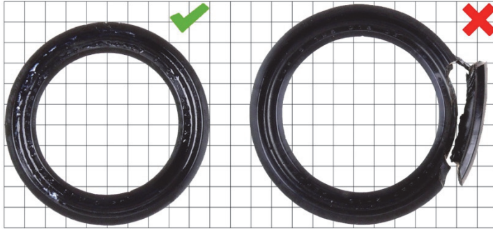
Res. 4: Yeni dudaklı conta halkası (1)

5 Sürgü kovanı (kalafattan dışarı itildi)