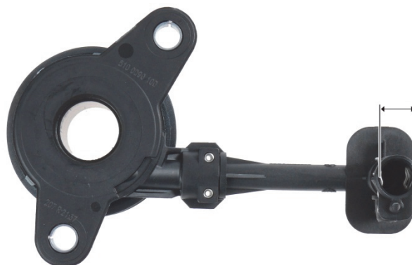
Obr. 4: CSC 82 600 140 → 3182 654 204 Hydraulický přívod o průměru 12,2 mm

Upozorňujeme, že hydraulické přívody koncentrických pracovních válců nejsou zobrazené v měřítku.