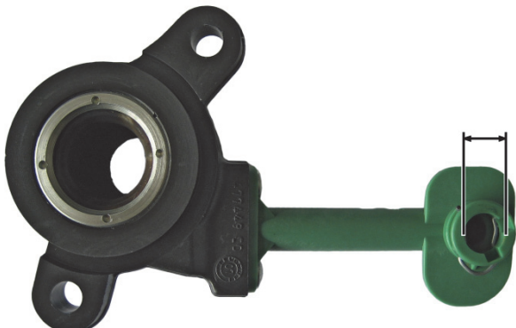
Obr. 1: CSC 3182 600 121 → 3182 654 165 Hydraulický přívod o průměru 11,7 mm