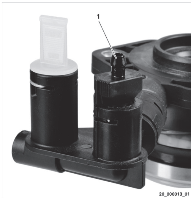
Sl. 2: Primer za različico A