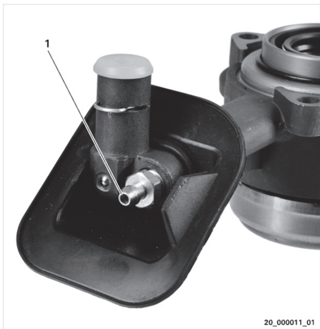
Sl. 1: Primer za različico A

Odzračite hidravlični sistem: Odprite odzračevalni nastavek..