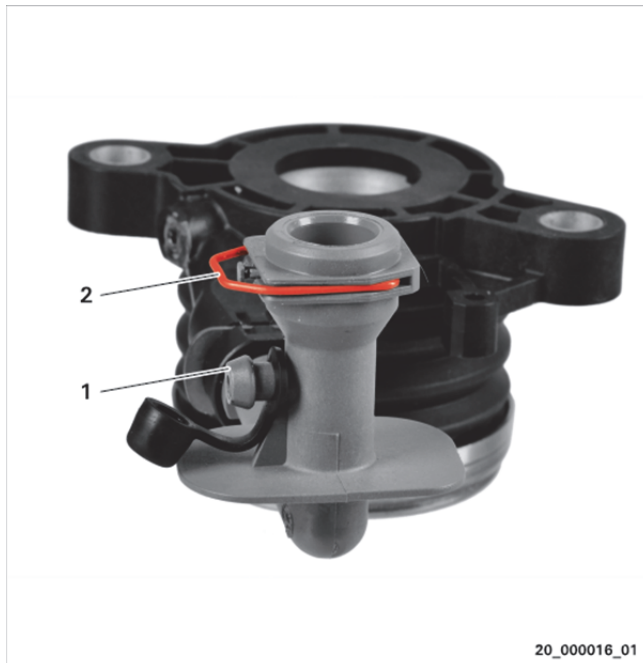
Sl. 3: Primer za različico B

Odzračite hidravlični sistem: Povlecite hidravlični vod za eno zarezo.