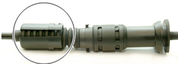
Рис. 3: Фиксатор ослаблен

➔ Положение тросового привода регулируется автоматически после нажатия педали сцепления.