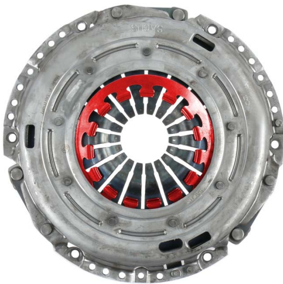
Fig. 4: Mola complementar deslocada

Aqui encontrará mais informações de serviço: www.zf.com/serviceinformation