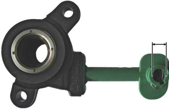
Afb. 1: CSC 3182 600 121 → 3182 654 165 Diameter hydraulische aansluiting: 11,7 mm