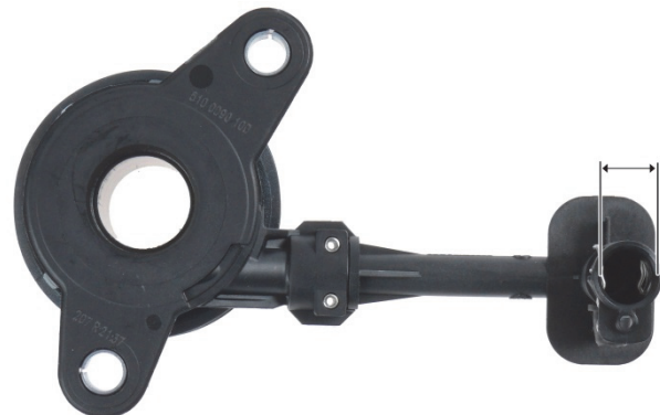
Afb. 4: CSC 3182 600 140 → 3182 654 204 Diameter hydraulische aansluiting: 12,2 mm

Houd er rekening mee dat de hydraulische aansluitingen van de druklagers niet op ware grootte zijn afgebeeld.