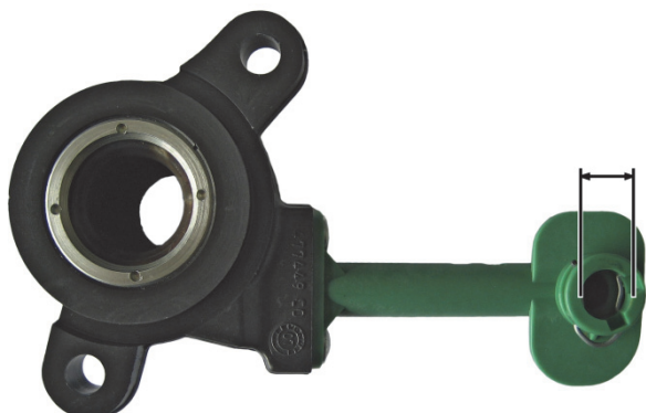
Sl. 1: CSC 3182 600 121 → 3182 654 165 Promjer hidrauličkog priključka 11,7 mm