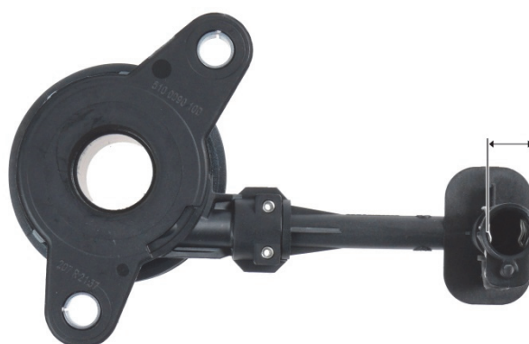
Sl. 4: CSC 3182 600 140 → 3182 654 204 Promjer hidrauličkog priključka 12,2 mm

Molimo uzmete u obzir da hidraulički priključci isključivača nisu prikazani u točnom mjerilu.