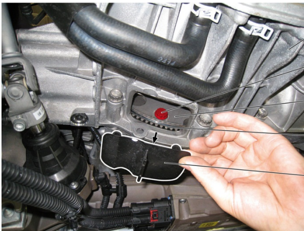
Fig. 1 : Démontez le couvercle (5)