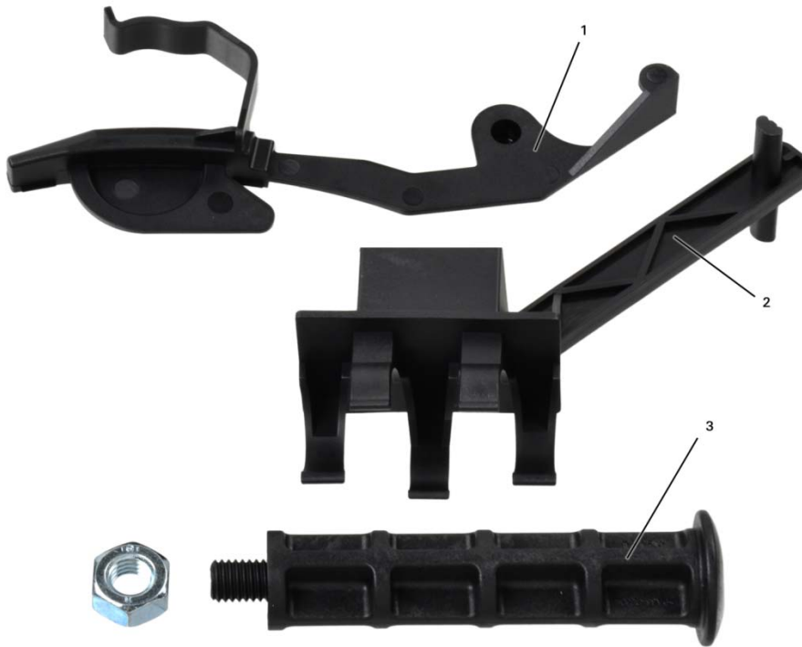
Fig. 4 : Outil de montage